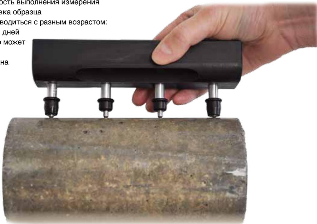
Resipod с 1,5" (38 мм) шагом датчика полностью совместим с указанным выше стандартом